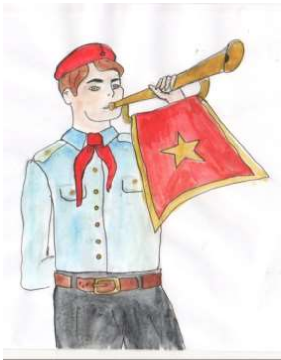
Рисунок Ильиной Анастасии, 9 класс