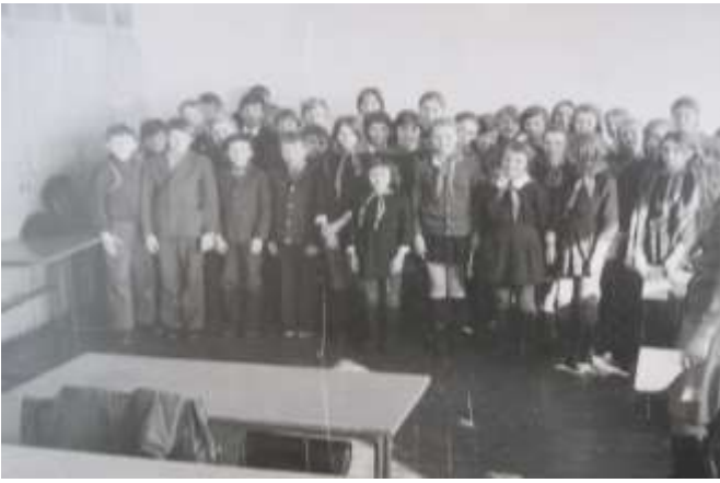
Пионерский отряд - 1978 год