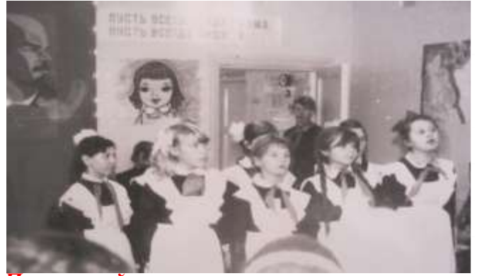
Пионерские праздники - "Мой край родной" - 1984 год