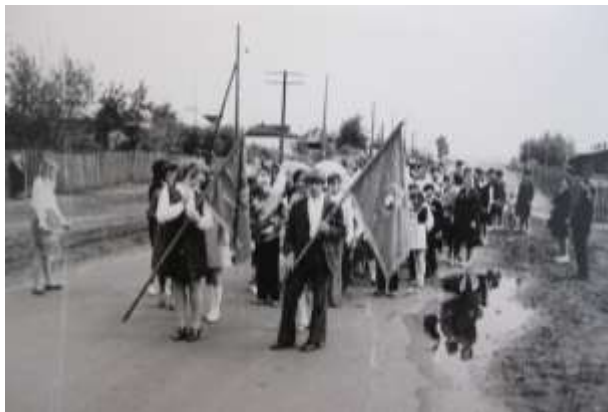
«Тимур и его команда»