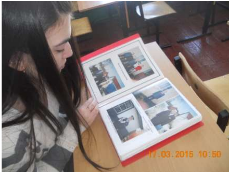
Работа в школьном музее, сбор информации для стенда.